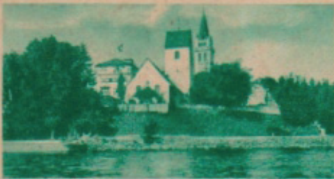
ROMANSHORN a. BODENSEE

POSTKARTE CARTE POSTALE CARTOLINA POSTALE